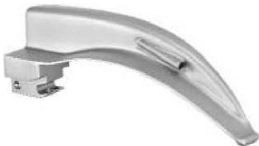
Sigma Light Faseroptik Spatel Sigma Light fiberoptic blades Sigma Light hojas de fibra óptica