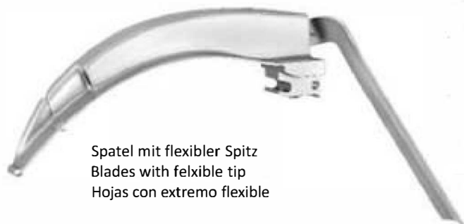
Spatel mit flexibler Spitz Blades with flexible tip Hojas con extremo flexible