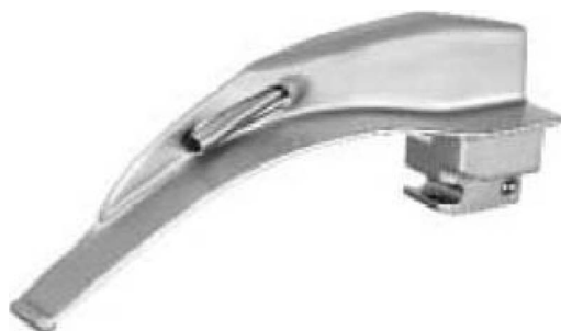
Sigma Light Faseroptik Spatel mit auswechselbarem Lichtleiter Sigma Light fiberoptic blades with interchangeable light guide Sigma Light hojas de fibra óptica con luz guía intercambiable