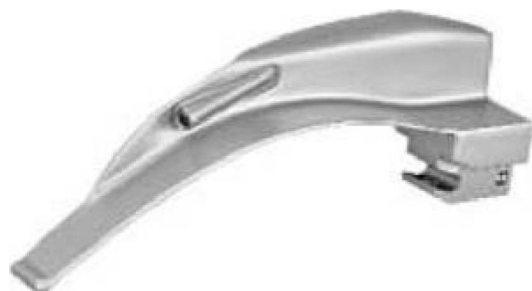
Sigma Light Faseroptik Spatel Sigma Light fiberoptic blades Sigma Light hojas de fibra óptica