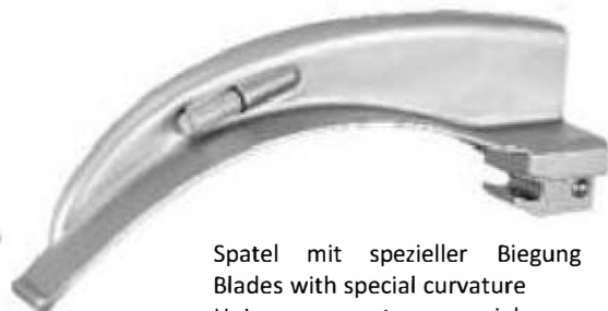
Spatel mit spezieller Biegung Blades with special curvature Hojas con curvatura especial