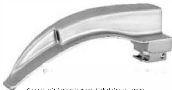
Spatel mit integriertem Lichtleiteraustritt Blades with integrated light guide Hojas con luz guía integrada