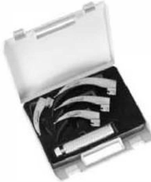
Delta Light Standard Spatel Delta Light conventional blades Delta Light hojas estándar