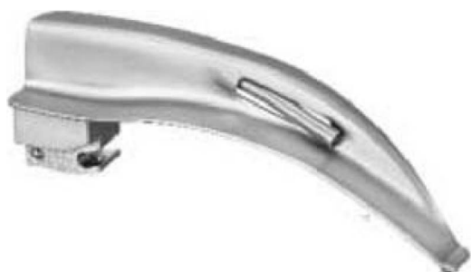
Sigma Light Faseroptik Spatel mit auswechselbarem Lichtleiter Sigma Light fiberoptic blades with interchangeable light guide Sigma Light hojas de fibra óptica con luz guía intercambiable