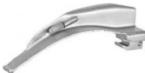
Delta Light Standard Spatel Delta Light conventional blades Delta Light hojas estándar