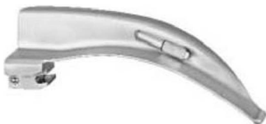
Delta Light Standard Spatel Delta Light conventional blades Delta Light hojas estándar